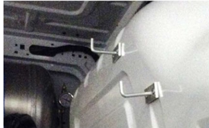
1 hook for inflation gun