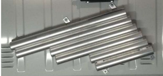
Lever and torque wrench support