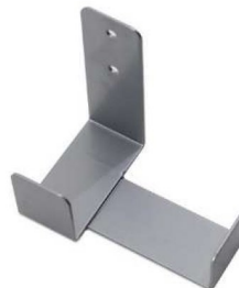
Truck impact wrench support