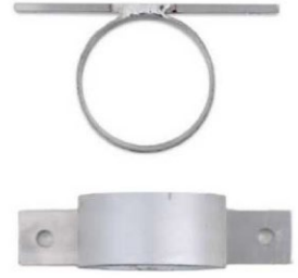
- 1/2" Impact wrench support - Holster for sledge hammer