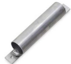
Holster for bead breaker